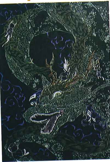
表面: colorful energy 裏面: 天夢苺花、アンゲルス、桜狐、吉田香奈、ペイ

アール・ド・ヴィーヴル展「カラフル・ポップ・萌え 尽きる事のない物語」は、障害福祉サービス事業所「アール・ド・ヴィーヴル」で活動する仲間たちが創作した作品から、アート・ディレクター 中津川浩章氏がキュレーションする展覧会です。